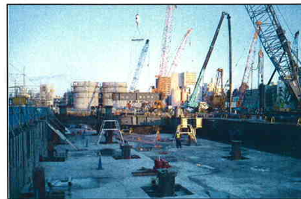
低層棟1階床鉄骨工事