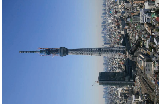
定点写真 平成23年4月20日 撮影