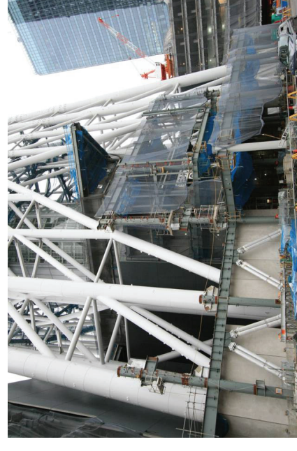
低層棟南側鉄骨建方及び外装工事施工状況