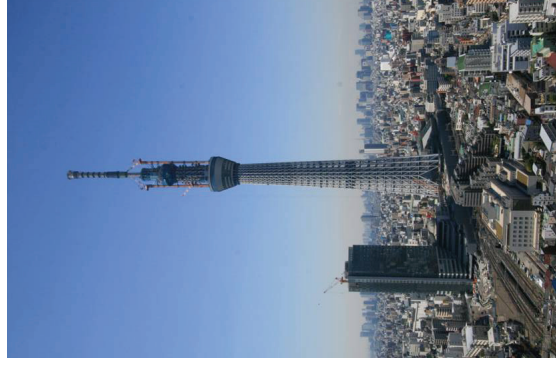
定点写真 平成23年4月20日 撮影