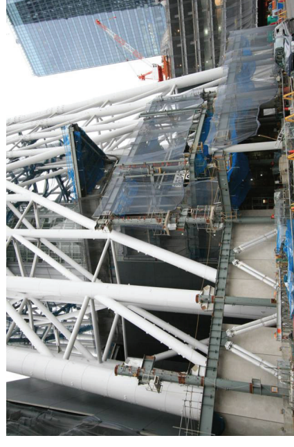
低層棟南側鉄骨建方及び外装工事施工状況