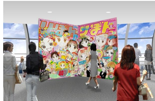
▲「りぼん」表紙フォトスポット（イメージ）

450mへ向かう天望回廊内は、「天使なんかじゃない」、「姫ちゃんのリボン」、「ママレード・ボーイ」の印象的なシーンで演出。また、窓辺の望遠鏡を覗くと眺望を背景に各作品のキスシーンが見える「恋する望遠鏡」を設置。刻一刻と変わりゆく空の色を楽しむとともに、漫画の世界に入り込んだかのような体験ができます。