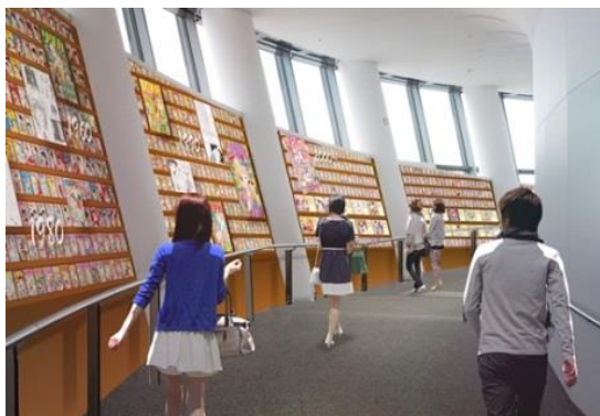
▲「りぼんライブラリー」(イメージ)

天望回廊にある451.2メートルの最高到達点ソラカラポイントには、人気作品のヒロインとヒーローたちとの写真が撮れるフォトスポットがあり、「りぼん」ファンとキャラクターが1つになれる場所となります。