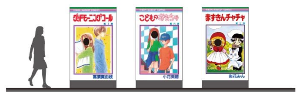
▲「なりきり！フォトスポット」（イメージ）