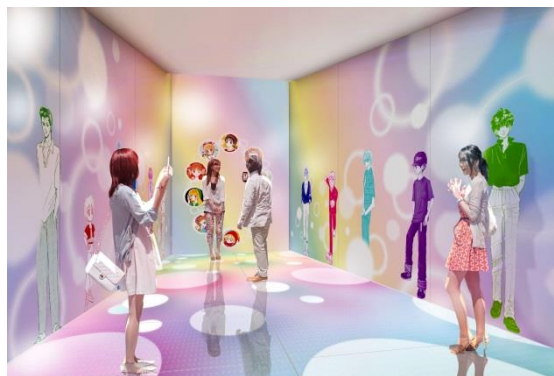
▲ソラカラポイント「イケメン☆カーニバル」装飾(イメージ)