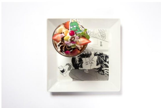
「晃と翠のマーブルチョコパフェ」 ¥950 コラボ作品：天使なんかじゃない

作品に登場するキャラクターポコ太の好きなドーナツにホイップクリームとフルーツを添え、物語の中でも特に印象的な赤のリボンの“もなか”をつけました。