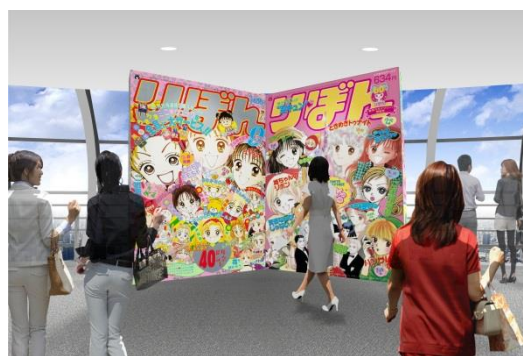
▲「りぼん」表紙フォトスポット(イメージ)

◎彩花みん、池野恋、一条ゆかり、小花美穂、高須賀由枝、水沢めぐみ、矢沢あい、矢沢漫画制作所、吉住渉/集英社・りぼん ◎TOKYO-SKYTREE