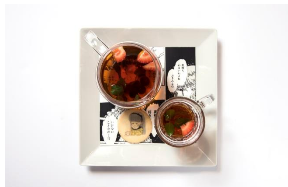
「蘭世のバンパイアティー」 ¥750 コラボ作品：ときめきトゥナイト

作品のヒーロー晃とヒロイン翠の代表的なキスシーンをイメージし、コーンフレーク、イチゴ、バナナ、ホイップクリーム、バニラアイスを使ったパフェにチョコレートソースをかけ、最後に作品中でも印象的なマーブルチョコと作品に登場するキャラクター、スドーザウルスの“もなか”をのせました。