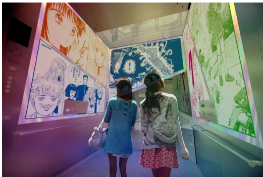
▲天望シャトル内装飾「はじまりの予感」（イメージ）

天望シャトル（エレベーター）には、歴代作品の名場面から“はじまりの予感”を感じさせる装飾や映像等で演出し、「りぼん」の世界観に入っていく期待感を高めます。天望回廊フロア445のエントランスには、人気作品のヒロインが一堂に会した東京スカイツリーオリジナル「りぼん」の表紙デザインと懐かしい過去の表紙のフォトスポットを設置します。