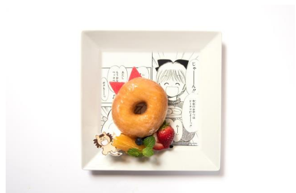
「ポコ太の大好きドーナツプレート」 ¥950 コラボ作品：姫ちゃんのリボン

※午前8時～午前10時にご注文いただいたお客さまには、コーヒーまたは紅茶がつきます。