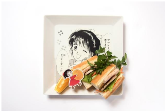
「チキン・ママレード・サンドイッチ」 ¥1,200 コラボ作品：ママレード・ボーイ

パンにママレードジャムを塗り、チーズ、ハーブチキン、レタス、キャロットラペをはさみ、ヘルシーかつカラフルな食材を使用した甘味と塩味が引き立つサンドです。