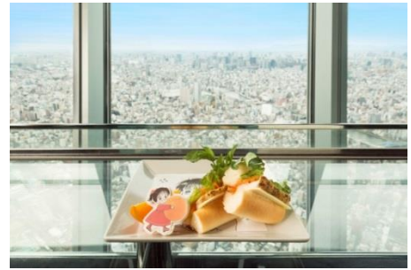
▲朝の眺望と共に楽しむ 「チキン・ママレード・サンドイッチ」 (イメージ)

期 間 2017年1月9日(月・祝)～3月31日(金) 場 所 東京スカイツリー天望デッキ フロア340 SKYTREE CAFE