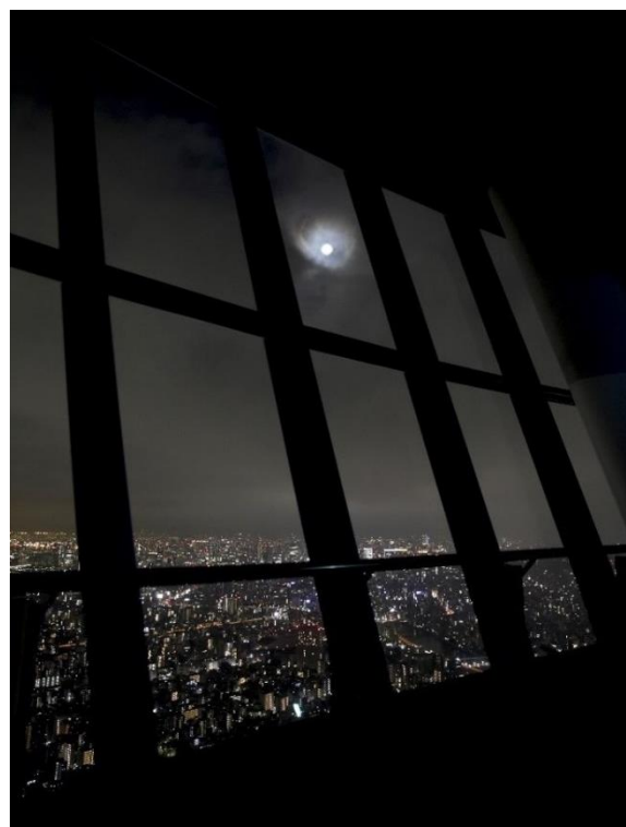
▲東京スカイツリー天望デッキから望む月と夜景