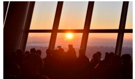
△東京スカイツリー展望台から眺めた 初日の出の様子