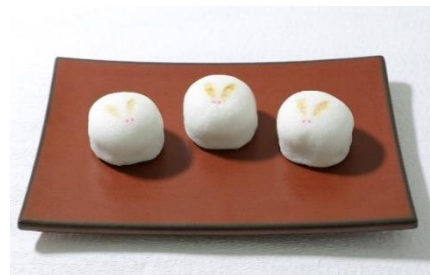
「うさぎまんじゅう」¥160

販売期間：9月10日(月)～9月24日(月・振休) 黄色のマカロンを月に見立てたお月見をイメージしたお菓子です。器の中はスポンジと小豆ミルクと抹茶ムースです。