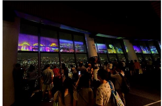
▲SKYTREE ROUND THEATER®「奇跡の月 Produced by 丸々もとお」(過去の様子)