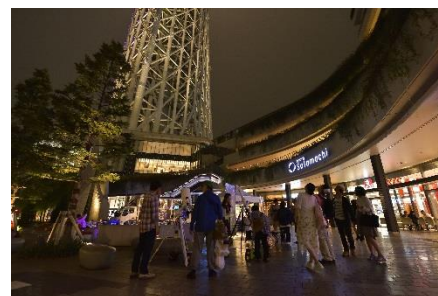
▲ソラマチひろばでの名月鑑賞会(昨年の様子)