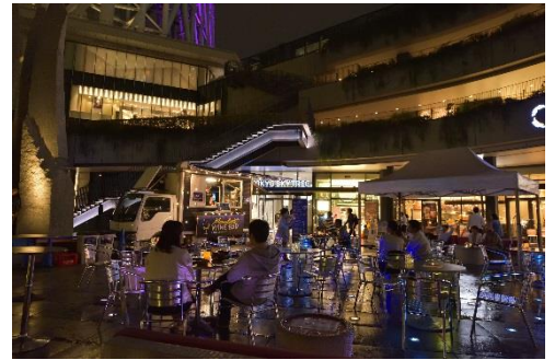
▲ Moonlight Wine Bar Produced by Rigoletto (昨年の様子)

東京ソラマチ*2階にある『RIGOLETTO ROTISSERIE AND WINE』が、東京スカイツリータウン*1階 ソラマチひろばにて『Moonlight Wine Bar Produced by Rigoletto』を開催します。東京スカイツリー*を見上げながら「月」をモチーフにした自慢のタパスやワインが味わえます。