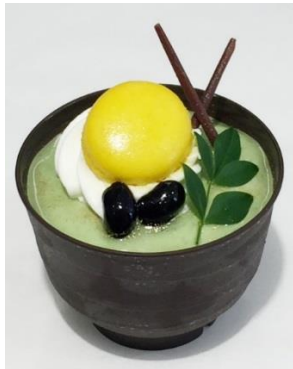
「小倉ミルクと抹茶のムース」¥540