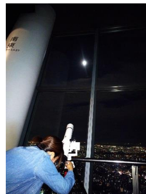
▲東京スカイツリー天望デッキでの名月鑑賞会(昨年の様子)