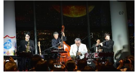
▲「Jazz in the Moon night」(昨年の様子)

地上350メートルの東京スカイツリー天望デッキで、9月7日(金)、14日(金)、21日(金)、28(金)の合計4日間、日本を代表するサクソフォーン奏者のMALTA氏率いるJazzユニット「MALTA Planet Band」およびシンガーソングライターのJILLE氏によるJazzライブを開催します。名月に照らされた東京の夜景を眺めながら、月にまつわるJazzの名曲など上質な音楽とともに贅沢な秋の夜長をお楽しみ下さい。