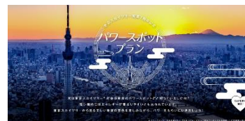
専用サイト イメージ

昨今、都内屈指のパワースポットとして知られる東京スカイツリー。開業7周年記念となる今年は、東京スカイツリーに加え、都内のパワースポットを選んで巡ることができるトーキョーブックマーク限定の特別プランをご用意しました。