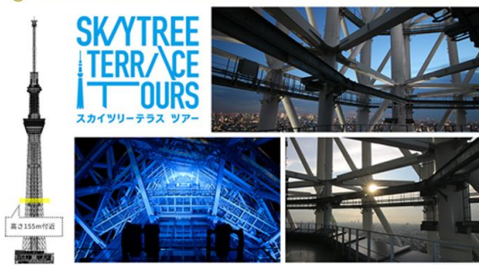
上記3枚：スカイツリーテラスツアー（イメージ）

結婚運・縁結びに良いとされる南東方向に向かってご縁を運んでくる風を感じながら良縁祈願！