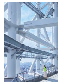
SKYTREE TERRACE TOURS