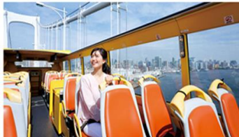
はとバスオー・ソラ・ミオ（イメージ）

東京各所の重要なエネルギー（気）をシンプルに必要なだけ取り込みたいときには、はとバスを利用するのがベスト！