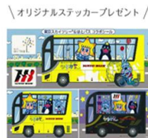
オリジナルステッカー（イメージ）