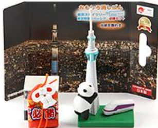
オリジナルグッズ

その他、お手軽にスカイツリーを楽しみたい方にお勧めの「東京スカイツリー開業7周年記念パワースポットプラン」もあります。プラン内容は、下記2点です。