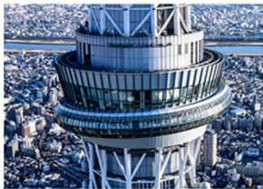
東京スカイツリー天望回廊（イメージ）