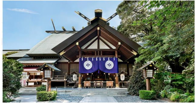
東京大神宮(イメージ)

「東京のお伊勢さま」と親しまれる神前結婚式創始の神社。 恋のパワースポットとしても人気がある縁結びの神社です。