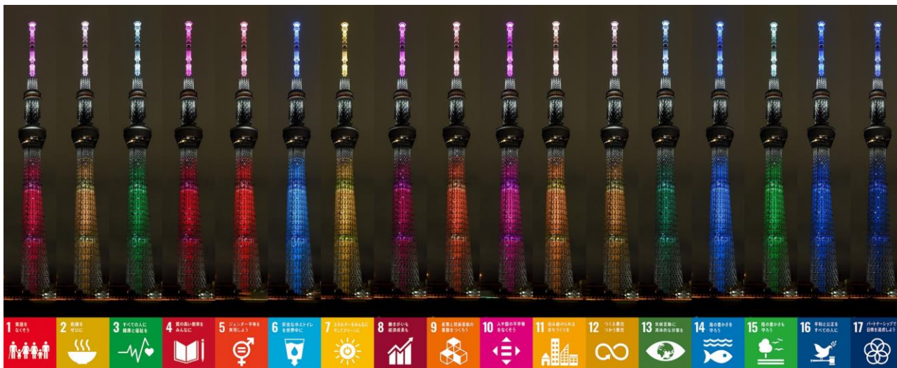
△SDGs の17色をイメージした特別ライティング