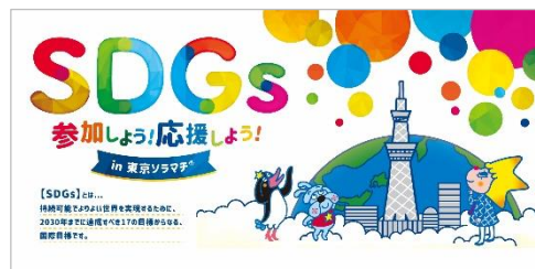
△「SDGs 参加しよう！応援しよう！ in 東京ソラマチ®」ロゴ

URL https://www.tokyo-solamachi.jp/event/1704/