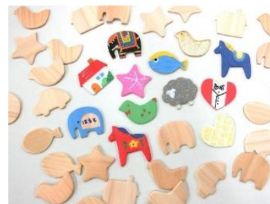
△「SDGs 参加しよう！応援しよう！ in 東京ソラマチ®」イベントイメージ